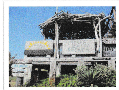
オーシャンビューテラス